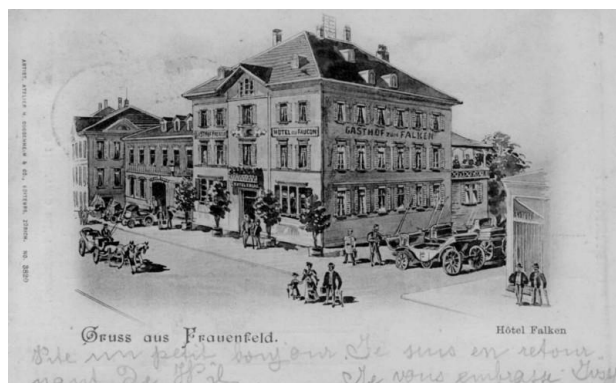
Postkarte um 1895